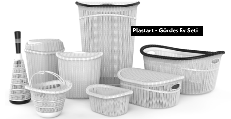
Plastart - Gördes Ev Seti

Plastart - Trendy Mikser: Trendy, servis yapmadan önce karıştırılması gereken içecekler için tasarlanmış karıştırıcı bir sürahidir. Meyve suları, limonatalar ve ayran gibi zamanla çökelti oluşturan içecekler için idealdir. Ana haznenin içerisine uzanan ana karıştırıcıya ek olarak sahip olduğu iki mini yüzey-mikseri sayesinde içeceğin hem üst hem de alt kısımlarında etkin ve homojen bir şekilde karışmasını sağlar. Bu özelliği ile örneğin köpüklü bir ayranın hazırlanmasında oldukça etkindir. Ergonomik bir tutuş sağlayan açılı ve dolgun kulp uzantısı