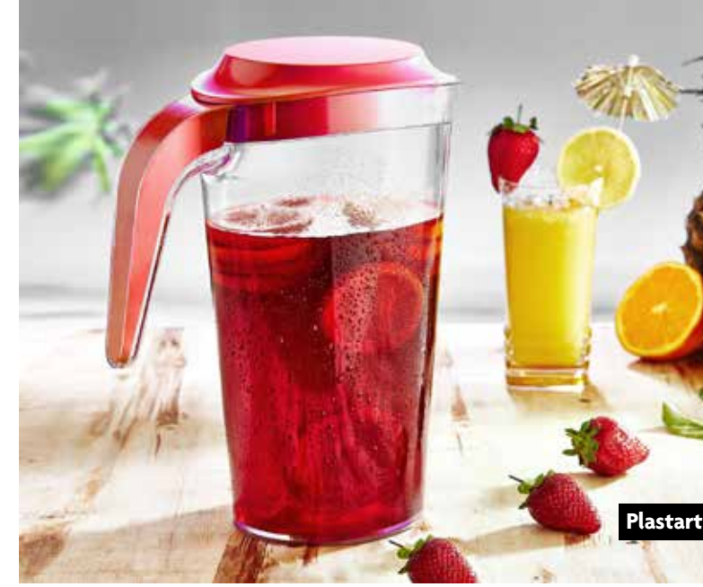
Plastart - Trendy Mikser

1996'da İstanbul Alman Lisesi'nden mezun oldum. 2001'de Boğaziçi Üniversitesi Makine Mühendisliği Bölümü'nü tamamladım. Yaratıcı sanatlara olan tutkumu ve pozitif bilimlere olan yatkınlığımı birleştirme isteğim beni Endüstriyel Tasarım dünyasına yönlendirdi. Sydney New South Wales Üniversitesi'nde Endüstriyel Tasarım bölümünde yüksek lisans eğitimimi tamamlayarak 2005'de İstanbul'a döndüm. Mordag Design Studio'yu kurmadan önce Eczacıbaşı Vitra ve T-Design firmalarında ürün tasarımcısı olarak çalıştım.