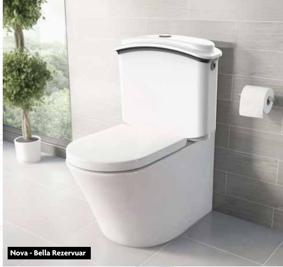
Nova - Bella Rezervuar

Nova - Bella Rezervuar : Bella, basmalı ve çekmeli boşaltma sistemlerini tek bir tasarım üzerinde sunan plastik bir rezervuar sistemidir. Projenin çıkışındaki ana hedef plastik rezervuarların üretim sonrası deformasyonlardan doğan kapak-gövde oturma sorunlarını çözebilecek bir yapı ortaya koyabilmektir. Bella'nın özel boyun tasarımı ve kapak-gövde oturma detayı ile bu sorun tamamen ortadan kalkmış oldu. Bu detaylandırma bugün plastik rezervuar pazarındaki en önemli patentlerden biridir. Bu çözümün önemli bir parçası olan Bella'nın boyunluk parçası, ürün üzerinde farklı renk kombinasyonları oluşturulmasına izin vermektedir. Bu özellikleri, Bella'ya iyi tasarım ödülü kazandırırken, aynı zamanda Nova markasının pazara görsel anlamda da bir ilki sunmasını sağladı.