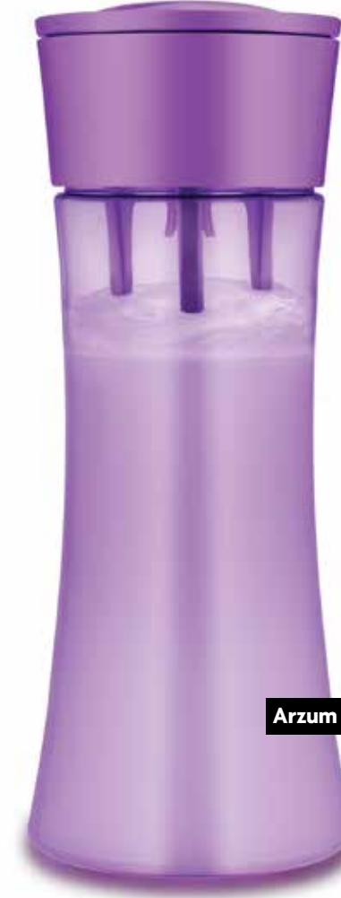
Arzum – Twister